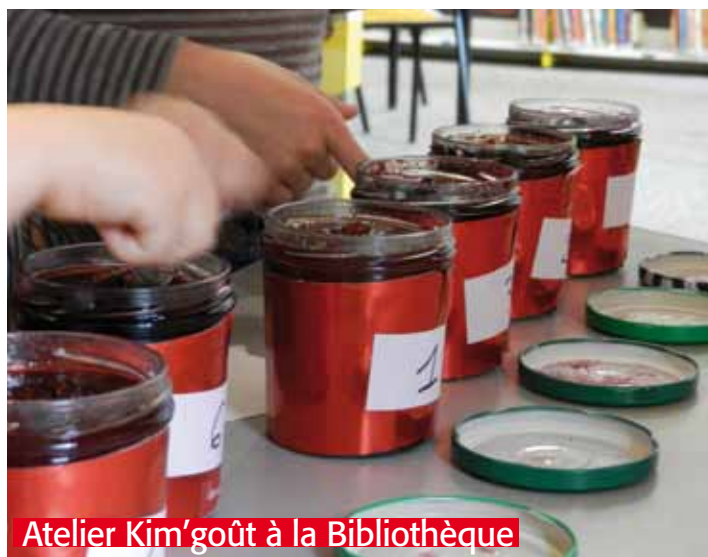
Atelier Kim'goût à la Bibliothèque

Depuis le début de l'année scolaire, la municipalité a mis en place une réflexion globale en proposant différentes actions sur la thématique culturelle « couleur ». L'année couleur est scindée en trois temps : rouge (octobre à décembre), bleu (janvier à avril) et jaune (mai à juin). Dans ce cadre, différentes actions sont conduites : exposition « Bleu Fragments » à la Maison de Pays du 23 mars au 14 avril 2013, expositions, théâtre, animations et lectures par la bibliothèque sur le rouge, le bleu et le jaune et diverses animations (repas, activités sur la couleur...) par le périscolaire et le Restaurant d'Enfants Municipal. Ces manifestations viseront un public très varié qu'il soit scolaire, grand public, ou même spécialiste. De nombreux partenariats sont se développent avec des acteurs locaux mais aussi avec les musées.