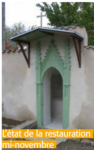
L'état de la restauration mi-novembre