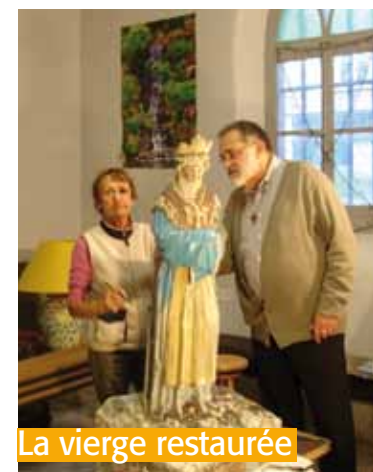
La vierge restaurée

Une inauguration de l'oratoire restauré est prévue conjointement entre la commune, la paroisse et les «Amis du Vieux Mornant» au mois de mai prochain.