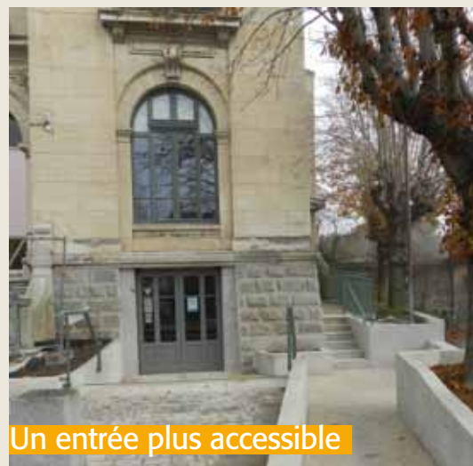
Un entrée plus accessible

Aussi, à l'occasion de la Journée Internationale des Personnes Handicapées, lundi 3 décembre, la municipalité a inauguré ce nouvel accès ainsi que les aménagements intérieurs.