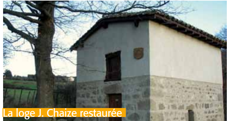
La loge J. Chaize restaurée

> Merci aux détenteurs d'informations sur certaines loges (photos, description, anecdotes, aide pour l'inventaire...) ou de suggestions d'en faire part au 06 72 38 11 97 ou à perrouin.claude@gmail.com