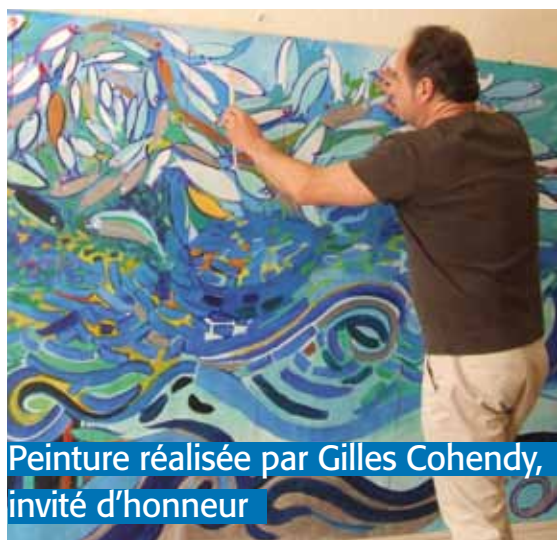
Peinture réalisée par Gilles Cohendy, invité d'honneur

Le programme de cette exposition est tout d'abord un questionnement de la couleur bleu dans l'histoire de l'art. L'exposition ne cherche pas à être exclusive en matière de bleu, mais à présenter quelques facettes de cette histoire. Cette exposition, hétéroclite par sa forme, se veut également pionnière sur Mornant grâce au choix des artistes sélectionnés.